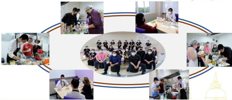
การพัฒนาเมนูอาหารใหม่ ภายใต้เทคนิค Molecular gastronomy และ Training บ่มเพาะผู้ประกอบการให้เกิด Local Expert Chef ในแต่ละชุมชน