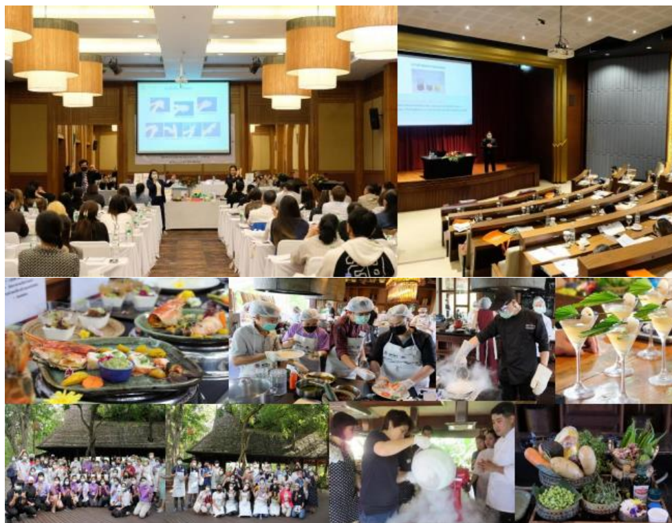
ภาพการดำเนินงาน